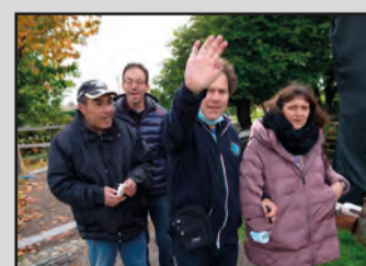
Mulino Segat \1