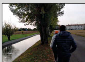
Mulino Segat \2