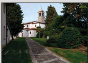
Chiesa di Valle

Mi fanno impazzire il paesaggio autunnale con le foglie che cadono e anche i colori che la natura ci mostra.