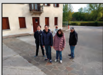
Canonica di Valle va vicino alla chiesa