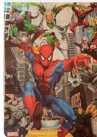
Puzzle su Spiderman realizzato da Luigi