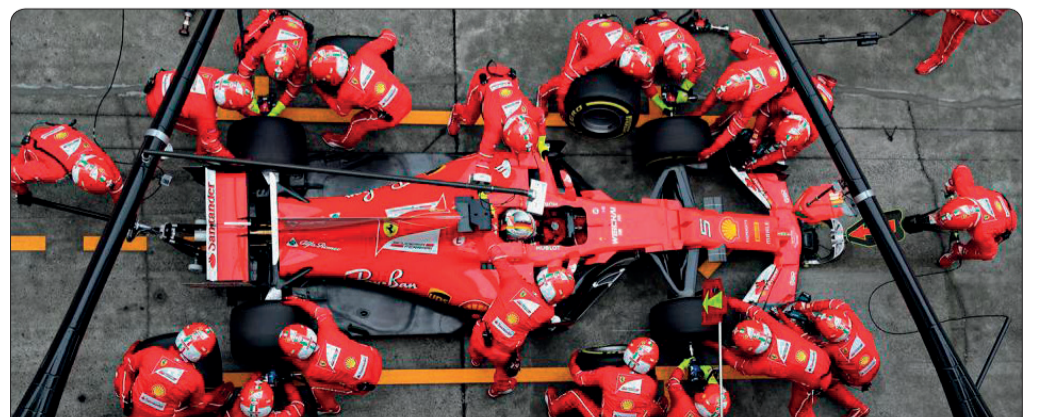
Il record per il cambio gomme più veloce è ancora detenuto dalla Ferrari

Mi piacerebbe potermi permettere una Ferrari ma purtroppo costa. Bisognerebbe chiedere al capo (Marchionne) se me ne regala una.