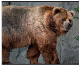
Un esemplare di Kociak

Ci sono tante specie di orsi, Kociak, orso bruno, Grizzli, Panda, orso nero, orso polare.