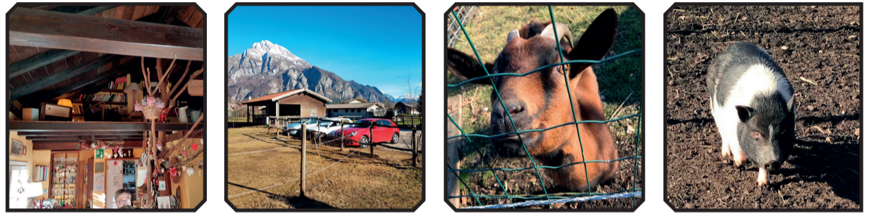
18.01.2018 GEMONA. SCUOLA ELEMENTARE E MEDIA "SANTA MARIA DEGLI ANGELI"