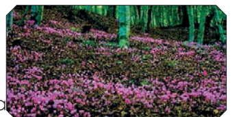
La maggior quantità di specie si trovano dalla zona in cui si trovano.