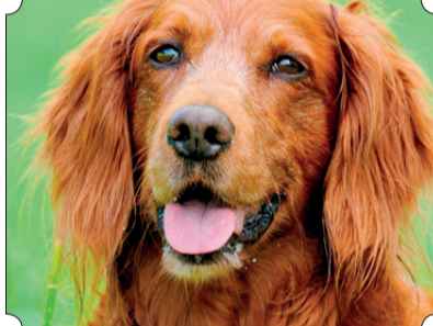
Un primo piano del setter

È un cane che fa anche l'attore nel cinema. I più famosi sono Rex, del telefilm "il commissario Rex" e Rin Tin Tin.