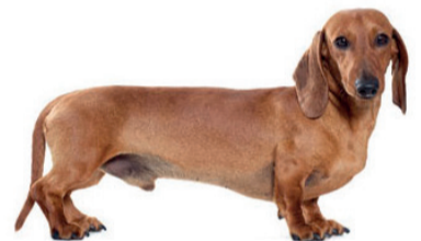
Un basso "bassotto"