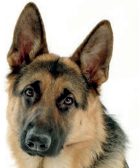
Un bellissimo esemplare di pastore tedesco