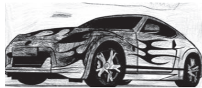
20 maggio 2015 LA MACCHINA SPORTIVA di Rudi C.

U na macchina veloce che corre e va forte. Va bene perché molto comoda, nel bagagliaio stanno le valigie, e i borsoni. Quando è piena parte, sta tutto dietro nel portabagagli (ci sta parecchia roba).